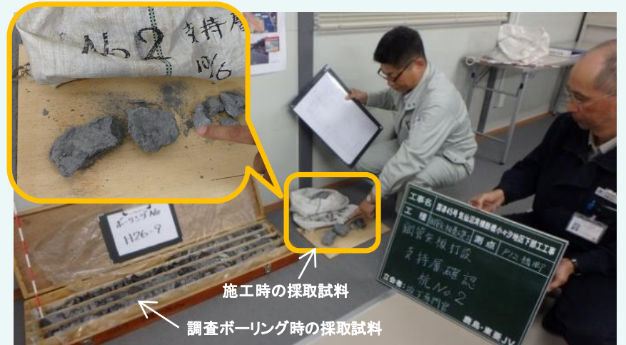
採取試料の確認状況

上記の鋼管矢板は、(仮称) 気仙沼湾横断橋全体の荷重を支える基礎構造物の杭基礎として大きな役目を担っていますので、この鋼管矢板が「支持層」と呼ばれる固い岩盤に入っているかどうかの確認はとても重要になります。 当工事では、調査ボーリング時に採取した支持層の試料と実際の鋼管矢板の施工時に採取した試料を発注者様立会いの下で見比べることにより、確認を実施しています。