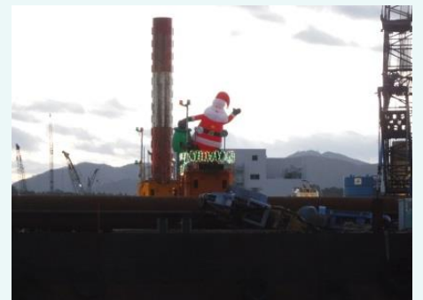
風が吹くとサンタが手を振っているように見えます。