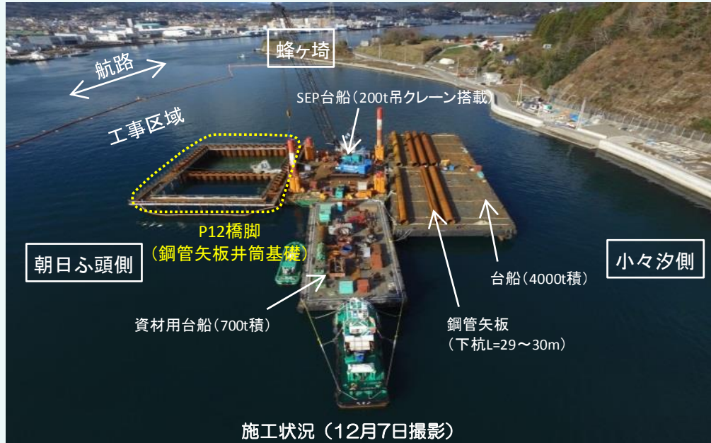
施工状況 (12月7日撮影)

9月から引き続き、杭基礎及び橋脚施工の際の遮水壁となる鋼管矢板の打設を行っています。全91本のうち隔壁部の15本の打設を完了し、現在は外周部の下杭の施工を行っています。この作業は来年の春頃まで続く予定です。