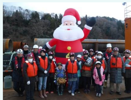
参加者全員で記念撮影

※ クリスマスイルミネーションについて 期間：平成27年12月5日～平成27年12月25日 時間：日没後～22：00頃まで ※荒天時および休工日は点灯しません。